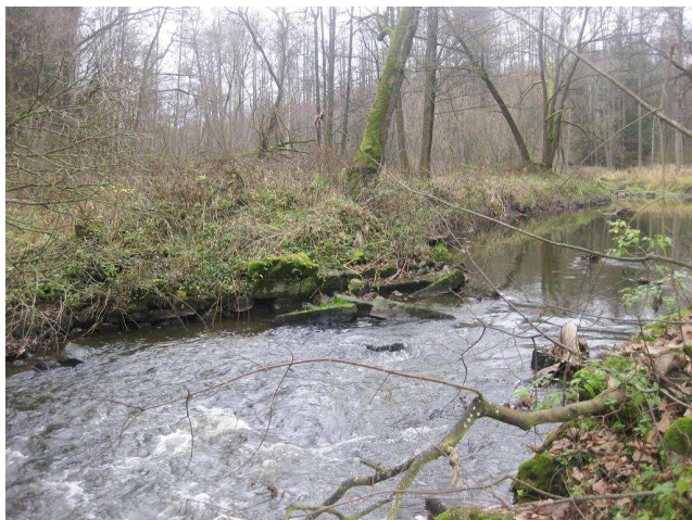
Pohled na bývalý jez