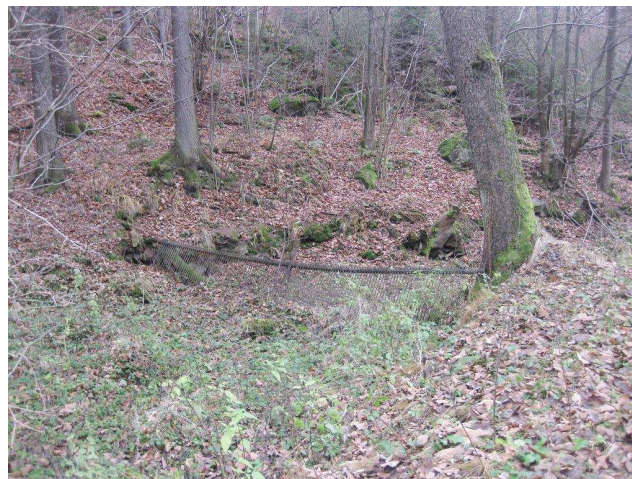
Bývalé koryto náhonu