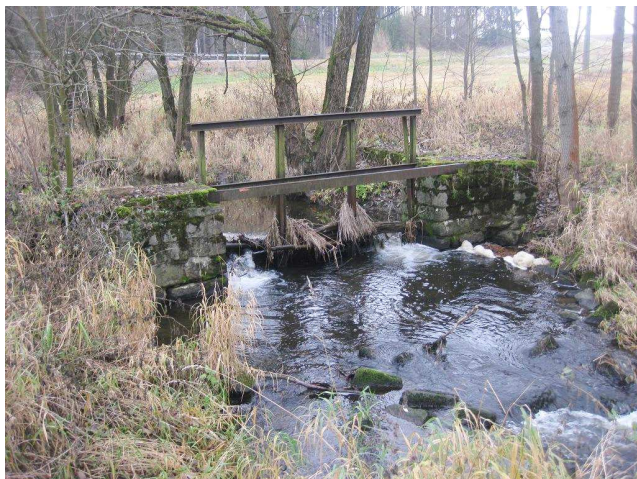
Pohled na nefunkční stavidlo