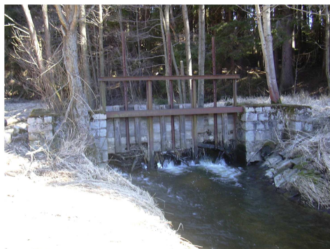
Pohled na stavidlo