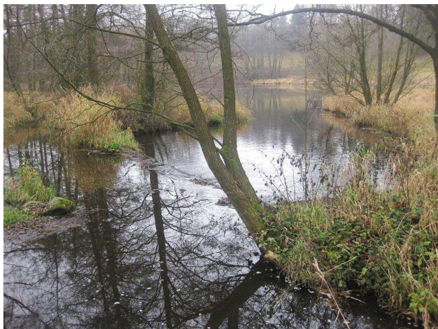
Pohled na stupeň s rybníkem v pozadí