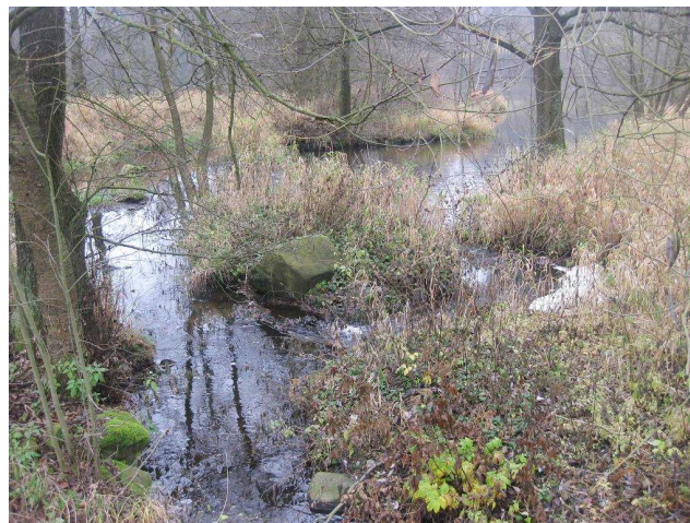
pravá strana stupně z průpichem