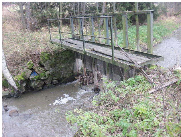
Celkový pohled na stavidlo