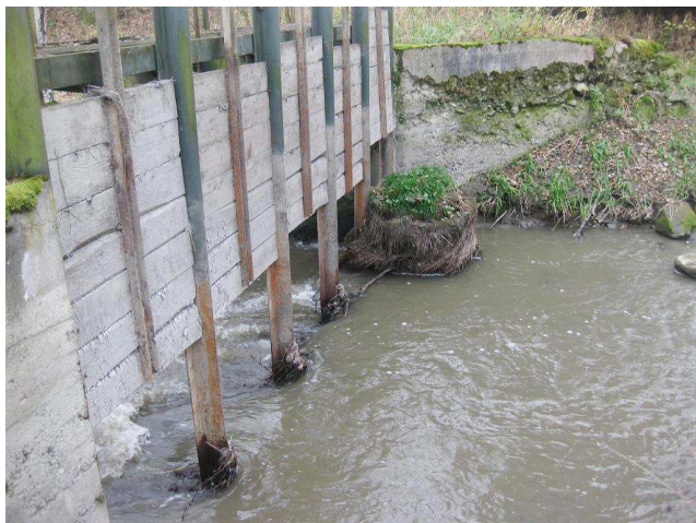
Pohled na vyhrazené stavidlo