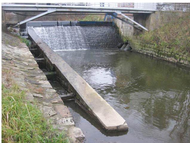
Pohled na jez s lávkou, vlevo RP