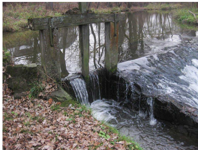
Jalová propust na jezu