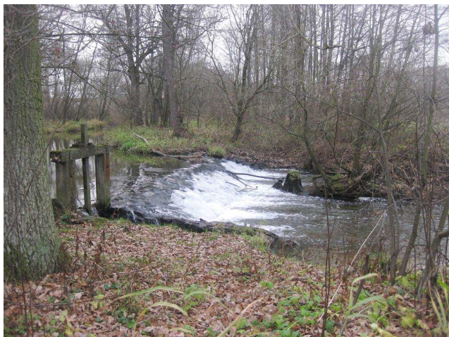
Pohled na jez, v popředí jalová propust