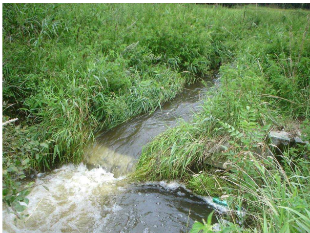
Pohled na stupeň