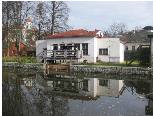
Objekt MVE na levém břehu