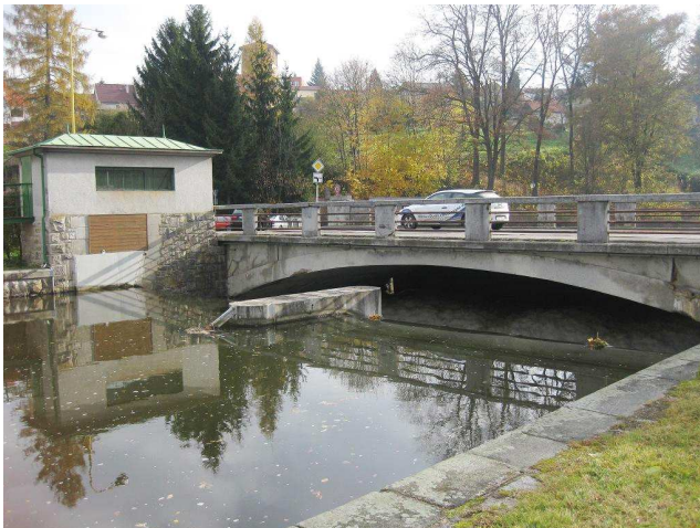
Pohled z nadjezí, přímo pod jezem je sliniční most