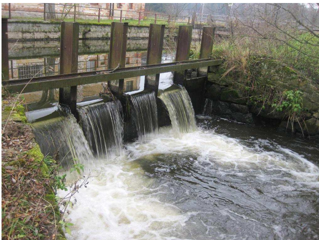
Pohled na jez